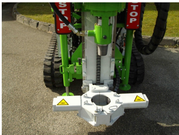
Frein de tige

Cette sondeuse est conforme aux normes CE, munies des arrêts d'urgence et de sécurité, sur le panneau de contrôle et sur la télécommande.